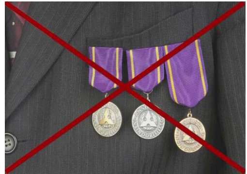
EI yhtä aikaa kultainen, hopeinen ja pronssinen ansiomitali