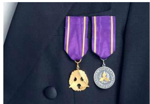
IL:n kunniajäsen- ja kultainen ansiomitali