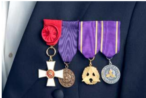
Suomen Leijonan 1. luokan ritarimerkki, Insinööriupseeriliiton ansiomitali, IL:n kunniajäsenmitali ja IL:n kultainen ansiomitali