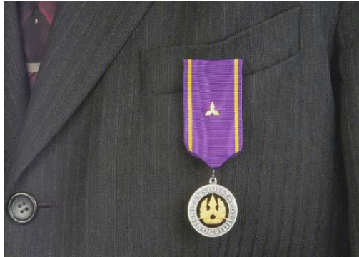
Kultainen ansiomitali soljin

Mikäli henkilöllä on useita Insinööriliiton myöntämiä ansiomitaleita, käytetään viimeksi myönnettyä mitalia. Poikkeuksen tekee kunniajäsenmitali, jota kannetaan aina ansiomitalin kanssa.